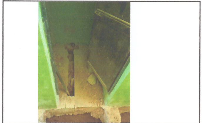
Foto 2: REMOZAMIENTO DE SISTEMA DE TUBERÍA DE DRENAJE QUE SE DIRIGE A LA FOSA SEPTICA